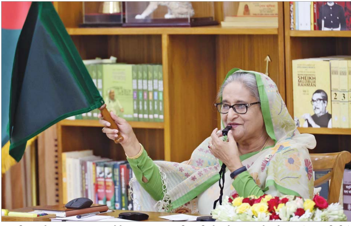
প্রধানমন্ত্রী শেখ হাসিনা রোববার গণভবন থেকে ভিডিও কনফারেন্সের মাধ্যমে নীলফামারীর চিলাহাটি প্রান্তে ঢাকা-চিলাহাটি-ঢাকা রুটে নতুন যাত্রীবাহী ট্রেন 'আন্তঃনগর চিলাহাটি এক্সপ্রেস' উদ্বোধন অনুষ্ঠানে হুইসেল বাজিয়ে এবং সবুজ পতাকা উড়িয়ে ট্রেন চলাচলের উদ্বোধন করেন।

চিলাহাটি এক্সপ্রেসের উদ্বোধন করলেন প্রধানমন্ত্রী নিজস্ব প্রতিবেদক : প্রধানমন্ত্রী শেখ হাসিনা আজ নতুন যাত্রীবাহী ট্রেন-চিলাহাটি এক্সপ্রেস উদ্বোধন করেছেন। ট্রেনটি চিলাহাটি-ঢাকা-চিলাহাটি রুটে চলাচল করবে। প্রধানমন্ত্রী নীলফামারীর চিলাহাটি রেলওয়ে স্টেশনে এক অনুষ্ঠানে প্রধান অতিথি হিসেবে তার সরকারি বাসভবন গণভবন থেকে ডায়ালি যোগানার মাধ্যমে হুইসেল বাজিয়ে ও পতাকা নেড়ে ট্রেনের উদ্বোধন করেন। আধুনিক সুযোগ-সুবিধা সহ ৮০০ জন যাত্রী বহনের ক্ষমতা সম্পন্ন নতুন চিলাহাটি এক্সপ্রেস সপ্তাহে ছয় দিন চিলাহাটি-ঢাকা-চিলাহাটিতে চলাচল করবে। হেলদিবাড়া-চিলাহাটি রুটে বাংলাদেশ ২-এর পাতায় দেখুন