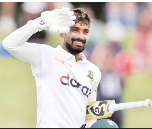
ঘরোয়া ক্রিকেটে প্রতিভার ছাপ রেখেছেন না সাময়ে। যদিও খুব ধারাবাহিক হতে পারেননি। তাই ঘরোয়া ক্রিকেটে তার ক্যারিয়ারও সমৃদ্ধ নয়। ২০টি প্রথম শ্রেণির ম্যাচে ২টি সেঞ্চুরি তার, ব্যাটিং গড় ৩৬.১৪। সবশেষ ঘরোয়া মৌসুমেও লাং বলের ক্রিকেটে ভালো কিছু করতে পারেননি ২১ বছর বয়সী ব্যাটসম্যান। জাতীয় লিগে ৬ ইনিংস খেলে স্রেফ ১১৫ রান করেছিলেন ১৯.৫৮ গড়ে। পরে বিসিএলে ৫ ইনিংসে ২ ফিফটিতে ১৯৪ রান করেন ৩৮.৭৯ গড়ে। তিনি টেস্ট দলে বাংলাদেশ দলের সদস্য। যুব বিশ্বকাপের পর প্রত্যাশিত গতিতে এগোয়নি তার ক্যারিয়ার। তবে