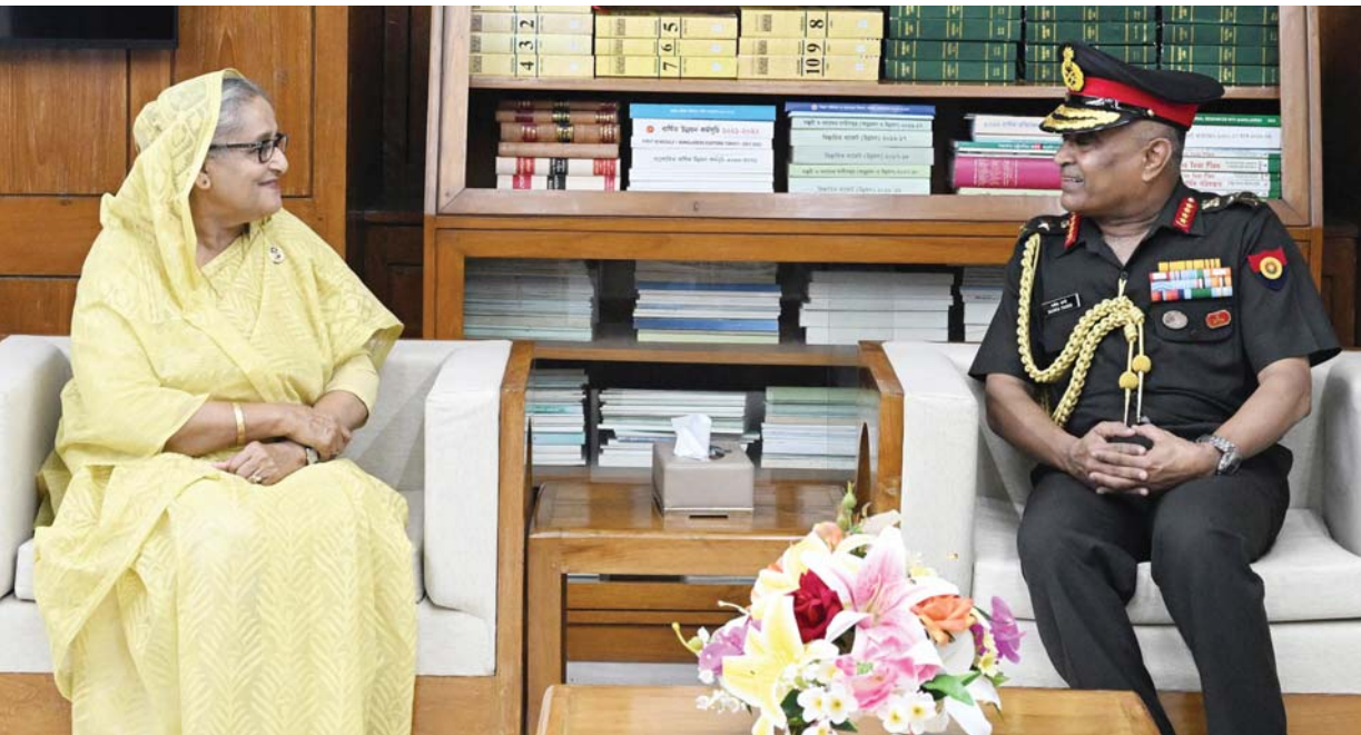
প্রধানমন্ত্রী শেখ হাসিনার সাথে মঙ্গলবার জাতীয় সংসদে তাঁর কার্যালয়ে ভারতের সেনাবাহিনী প্রধান জেনারেল মনোজ পাণ্ডে সৌজন্য সাক্ষাৎ করেন।