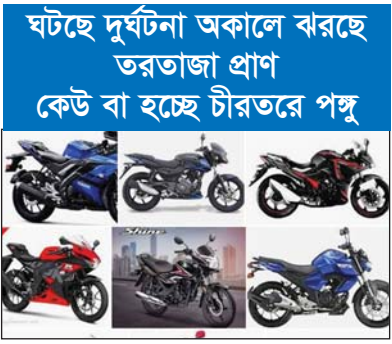
ঘটছে দুর্ঘটনা অকালে বরছে তরতাজা প্রাণ কেউ বা হচ্ছে চারতরে পঙ্গু

বিশেষ প্রতিবেদক : মেহেরপুরের গাংনীতে শিশু কিশোরদের হাতে রয়েছে নামী দামী ব্র্যান্ডের দ্রুতগামী মোটরসাইকেল। আর এসব যান নিয়ে দাপিয়ে বেড়াচ্ছে শহর ও গ্রামাঞ্চলের রাস্তা। ঘটছে দুর্ঘটনা। প্রাণহানী ঘটছে অনেকের। আবার কেউ কেউ পঙ্গু হচ্ছে চারতরে। তার পরও ধামাচৌঁড়ে যাচ্ছে না ওই সব কিশোরদের। ট্রাফিক পুলিশেরও কোন উদ্যোগ চোখে পড়ে না। দেখা গেছে, গাংনীর বিভিন্ন সড়ক মহাসড়কে শিশু ও কিশোররা দ্রুত বেগে মোটর সাইকেল চালাচ্ছে। নামী দামী ব্র্যান্ডের এসব মোটর সাইকেলের কোন রেজিস্ট্রেশন নেই। অন্যদিকে চালকদেরও নেই কোন ড্রাইভিং লাইসেন্স। ফলে হরহামেশা দুর্ঘটনা ঘটছে। গাংনীর স্বাস্থ্য কমপ্লেক্স ও বিভিন্ন ক্লিনিকের তথ্যানুযায়ী গাংনীতে ৬ মাসে ৪১ টি মোটর সাইকেল দুর্ঘটনা ঘটে। এতে দুই