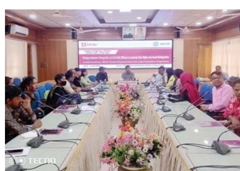
২-এর পাতায় দেখুন