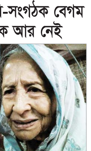
২-এর পাতায় দেখুন