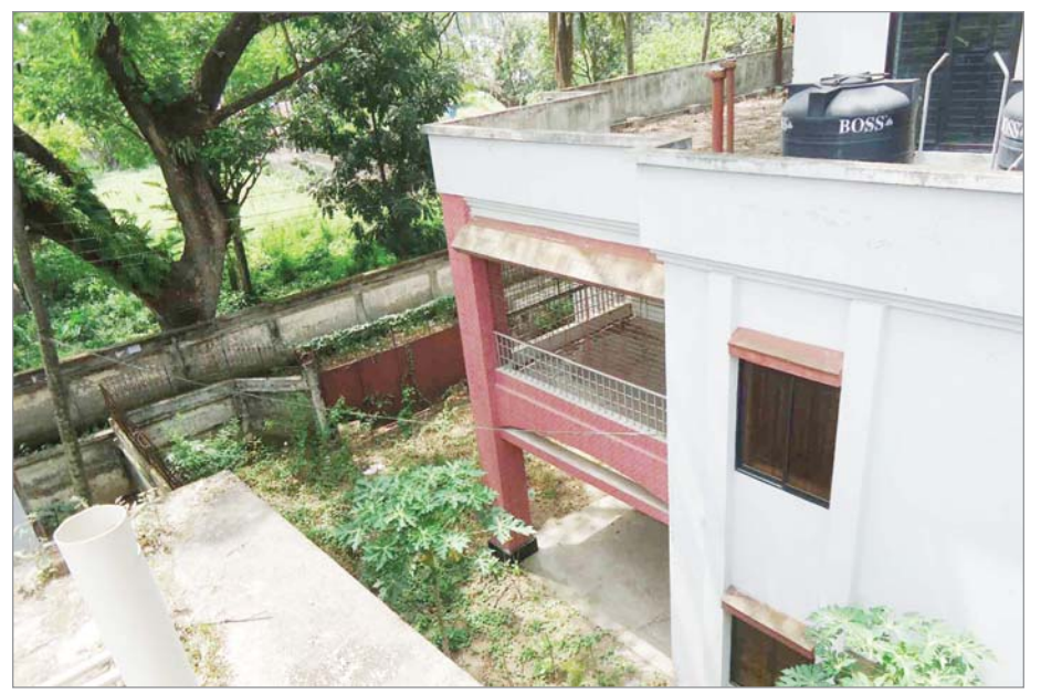
বিনাইদহ জেলা পরিষদের সরকারি কর্মকর্তার জন্য তৈরী করা বাসভবনটি প্রায় ৬/৭ বছর খালি অবস্থায় পড়ে আছে। ব্যবহার না করায় ইমারত ও আনুসঙ্গিক স্থাপনা দীর্ঘদিন ব্যবহার না করায় নষ্ট হয়ে যাচ্ছে। এ বিষয়ে অনুরূপ কার্যক্রম নিচ্ছে না। ফলে সরকার লক্ষ লক্ষ টাকার রাজস্ব আয় থেকে বঞ্চিত হচ্ছে।

নিজস্ব প্রতিবেদক : খুলনা সিটি কর্পোরেশন (কেসিসি) নির্বাচন অনুষ্ঠিত হয়েছে। ঘোষিত ফলাফলে বৈধ ভোটের আট ভাগের এক ভাগ ভোট না পাওয়ায় তিন মেয়র প্রার্থী জামানত হারাচ্ছেন। গত সোমবার (১২ জুন) সকাল ৮টা থেকে বিকেল ৪টা পর্যন্ত বিরতিহীনভাবে ইলেক্ট্রনিক ভোটিং মেশিনে (ইভিএম) ভোটগ্রহণ হয়। ভোটগ্রহণ শেষে রাত ৯টার দিকে মেয়র পদে বেসরকারিভাবে ফলাফল ঘোষণা করেন কেসিসি নির্বাচনের রিটার্নিং কর্মকর্তা মো. আলোউদ্দিন। ঘোষিত ফলাফল অনুযায়ী, এবারের নির্বাচনে ৫ লাখ ৩৫ হাজার ৫২৯ জন ভোটারের মধ্যে ভোট দিয়েছেন ২ লাখ ৫৭ হাজার ৯৩৬ জন। যার মধ্যে ১ হাজার ৬৬৯ ভোট বাতিল হয়েছে। আর বৈধ ভোটের সংখ্যা ২ লাখ ৫৬ হাজার ২৬৭। ৪৮ দশমিক ১৭ শতাংশ ভোট কাঁসি হয়েছে। কেসিসি নির্বাচনের রিটার্নিং কর্মকর্তা মো. আলোউদ্দিন বলেন, কোনো প্রার্থীকে জামানত রক্ষা করতে হলে মোট প্রদত্ত বৈধ ভোটের আট ভাগের এক ভাগ ভোট পেতে হবে। নির্বাচন কমিশনের বিধিমালা অনুযায়ী, কোনো প্রার্থীকে জামানত রক্ষা করতে হলে মোট প্রদত্ত বৈধ ভোটের আট ভাগের এক ভাগ ভোট পেতে হবে। সেই অনুযায়ী কেসিসি নির্বাচনে ৩২ হাজার ২৪২ ভোটের কম পাওয়ায় তিন মেয়র প্রার্থী জামানত হারাচ্ছেন।