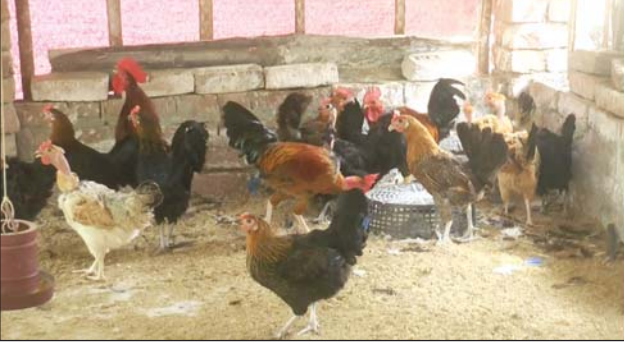
২০১৩-২০১৪ অর্থবছর থেকে দেশীয় প্রজাতির মুরগি পালন প্রকল্পটি চালু করে। মেহেরপুর জেলার গাংনী উপজেলায় প্রকল্পটি বাস্তবায়ন

মেহেরপুর প্রতিনিধি: সল্প বিনিয়োগ ও অল্প সময়ে দেশি মুরগি পালন করে সাবলম্বী হচ্ছেন মেহেরপুরের নারীরা। পরিবারের পুষ্টির চাহিদা পূরণের পাশাপাশি বাড়তি আয়ের সুযোগ সৃষ্টির অন্যতম মাধ্যম দেশি প্রজাতির মুরগি পালন। স্বল্প বিনিয়োগ, সহজ ব্যবস্থাপনা ও ভালো বাজার দরের কারণে দেশি মুরগি পালন জেলার বিভিন্ন গ্রামের নারীদের সৌখিন ও পছন্দের পোষায় পরিনত হয়েছে। এতে একদিকে যেমন পরিবারের মাংসের চাহিদা পূরণ হচ্ছে অন্যদিকে বাড়তি আয়ের উৎস বলেও মনে করছেন গৃহিণীরা।