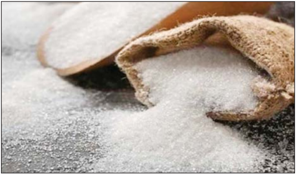
রা মানছেন না। বাজারে প্রতিবেদকে চিনি ১৩৫ টাকা থেকে ১৪০ টাকায়, আন্তর্জাতিক ২-এর পাতায় দেখুন

নিজস্ব প্রতিবেদক : আগামী ২২ জুন থেকে প্রতিবেদকে খোলা চিনি ১৪০ টাকা এবং প্যাকেট চিনি ১৫০ টাকার বিক্রির সিদ্ধান্ত জানিয়েছেন মিল মালিকরা। কোরবানির ঈদের আগে ২২ জুন থেকে চিনির দাম কেজিতে সর্বোচ্চ ২৫ টাকা করে বাড়ানোর কথা বাণিজ্য মন্ত্রণালয়কে চিঠি দিয়ে জানিয়েছেন মিল মালিকরা। সামবার গুণার রিফাইনার্স অ্যাসোসিয়েশনের পক্ষ থেকে বাণিজ্য সচিব বরাবর ওই চিঠি পাঠানো হয়। বর্তমানে প্রতিবেদকে খোলা চিনি ১২০ টাকা এবং প্যাকেট চিনি ১২৫ টাকা নির্ধারিত আছে। তবে সরকার নির্ধারিত এই দাম ব্যবসায়ী-