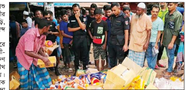
টাকা জরিমানা ও গোডাউনটি সিদ্ধান্ত দেয়া হয়। পরে জব্দকৃত নকল