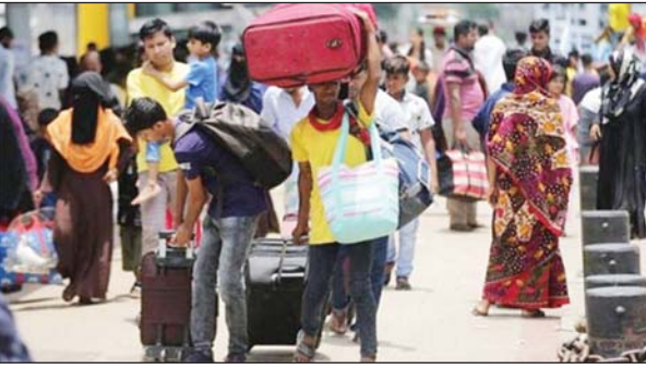
নিয়ে যাত্রায় ফিরছেন যাত্রীরা। গত দুদিন রাজধানীর কমলাপুর রেলওয়ে স্টেশন ঘুরে এমন চিত্রই দেখা গেছে। গতকাল সোমবার সকালে

স্টাফ রিপোর্টার : পরিবার-পরিজনদের সঙ্গে ঈদ আনন্দ ভাগাভাগি করতে নাড়ির টানে বাড়ি ফেরা মানুষ ঈদের ছুটি কাটিয়ে রাজধানীতে ফিরতে শুরু করেছে। ঈদুল আজহা ঘিরে এ বছর রাজধানী ছাড়াই প্রায় ১ কোটি মানুষ। ঈদ শেষে তারা স্বজন্মের সঙ্গে কাটানো সুন্দর মুহূর্তগুলোর স্মৃতি নিয়ে ফিরছেন ঢাকায়। গত দুদিন ধরেই ঈদের ফিরতি যাত্রায় কেউ বাসে, কেউ লঞ্চে, কেউ ট্রেনে করে ঢাকায় ফিরছেন। ঈদযাত্রায় সড়কপথে কোনো কোনো জায়গায় যাত্রীদের যানজটের ভোগান্তি এবং লঞ্চে যাত্রী কম থাকায় ছাড়ার দীর্ঘ অপেক্ষা থাকলেও গত ঈদুল ফিতরের মতো ঈদুল আজহায়ও রেলপথে তুলনামূলক স্বস্তি