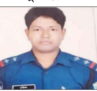
২-এর পাতায় দেখুন