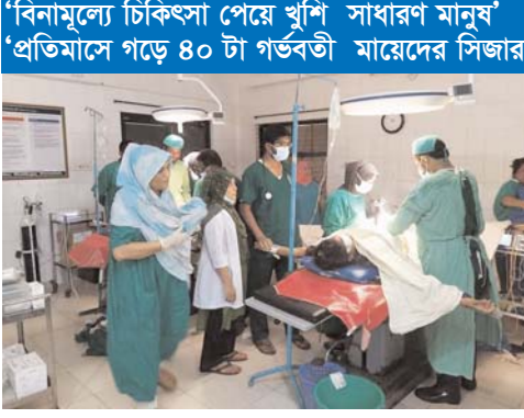
সপ্তাহে দুইদিন সম্পূর্ণ বিনামূল্যে সিজার ও অন্যান্য অপারেশন করা হচ্ছে। এক্ষেত্রে, প্রতি