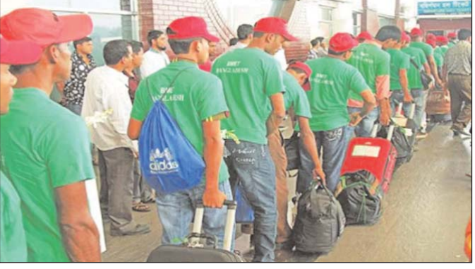
সরকারকে দক্ষ জনশক্তির তুলনায় অদক্ষ জনশক্তিই বেশি রপ্তানি করতে হয়েছে। ফলে সংখ্যার দিক থেকে রপ্তানি বাড়লেও হার অনুযায়ী

স্টাফ রিপোর্টার : দেশ থেকে জনশক্তি রপ্তানি বাড়লেও দক্ষ কর্মী পাঠানোর পরিমাণ বাড়ছে না। আর দক্ষ কর্মী না হওয়ায় বাংলাদেশী অভিবাসীদের মাসিক আয় অন্যান্য দেশের তুলনায় অনেক কম। একজন বাংলাদেশী অভিবাসীর গড় মাসিক আয় ২০৩ ডলার। বিগত ১৯৯১ সাল থেকে ২০২১ পর্যন্ত মোট ১ কোটি ২৯ লাখ ৬ হাজার ৪৬১ জনকে প্রবাসে গিয়েছে। কিন্তু তাদের মধ্যে ৩৩ শতাংশ দক্ষ, ১৪ শতাংশ ৯৯ আংশিক দক্ষ এবং ৪৮ শতাংশ ৫ শতাংশ অদক্ষ জনশক্তি। বিগত চার দশকে