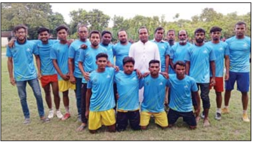
যোষণা দেন তিনি। এমন যোষণার ২৪ ঘণ্টা না যেতেই গতকাল বিকালে সারুটিয়া ফুটবল টিমকে একসেট জার্সি, একটি ফুটবল ও নগদ ২-এর পাতায় দেখুন

নিজস্ব প্রতিবেদক : শৈলকুপার শৈলকুপার বীরমুক্তিযোদ্ধা নুরে আলম সিদ্দিকী আন্তঃইউনিয়ন ফুটবল টুর্নামেন্টে ২য় সেমিফাইনাল ম্যাচে হাকিমপুর ইউনিয়ন একাদমকে ৩-১ গোলের ব্যবধানে পরাজয় করে ফাইনালের চিকিৎসা অর্জন করেছেন সারুটিয়া ইউনিয়ন একাদম। এ বিজয়ের খবর ফেসবুকসহ বিভিন্ন অনলাইনে ছড়িয়ে পড়ে। সে খবরটি নজর কাড়ে উপজেলার সারুটিয়া ইউনিয়নের কৃতি