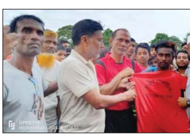
২-এর পাতায় দেখুন

মেহেরপুর প্রতিবেদক : মেহেরপুর সদর উপজেলার গোভীপুর ৬ষ্ঠ ডেব্রব ক্লাব কাপ ফুটবল টুর্নামেন্টে ময়ামারি একাদশ জয়লাভ করেছে। মঙ্গলবার বিকেলে গোভীপুর বিদ্যালয় মাঠে অনুষ্ঠিত খেলায় ময়ামারি একাদশ ২-০ গোলে রায়পুর ফুটবল একাদশকে পরাজিত করে। খেলায় দ্বিতীয়বারের ১১ মিনিটে জীবন এবং এর ১ মিনিট পরে সাল্কির ১ টি গোল করেন ময়ামারি একাদশ খেলার প্রথমার্ধে অন্তত