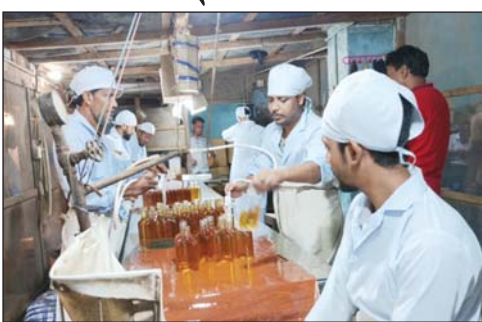
২-এর পাতায় দেখুন

নিজস্ব প্রতিবেদক : ২০২২-২৩ অর্থবছরে ৫৯ লাখ ৬৭ হাজার গ্রুফ লিটার মদ উৎপাদন হয়েছে। মদ বিক্রি করে আয় হয়েছে ৪৩৯ কোটি টাকা প্রায়। রাজস্ব জমা দেওয়ার পর মদ বিক্রি থেকে নিট আয় দাঁড়ায় ১৫২ কোটি টাকা। চিনিকল ছাড়া কেরু এ্যান্ড কোম্পানির সব ইউনিট এবার লাভের মুখ দেখেছে। ২০২২-২৩ অর্থবছরে রেকর্ড পরিমাণ মদ