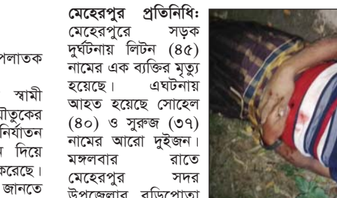
২-এর পাতায় দেখুন