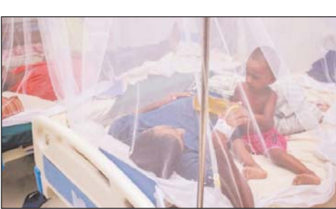
২-এর পাতায় দেখুন

নিজস্ব প্রতিবেদক : ডেঙ্গু জ্বরে আক্রান্ত হয়ে গত ২৪ ঘণ্টায় সারাদেশে ১০ জনের মৃত্যু হয়েছে। এ নিয়ে চরমিত বছর ডেঙ্গু আক্রান্ত হয়ে মৃতের সংখ্যা দাঁড়িয়েছে ২৯৩ জনে। এছাড়া গত ২৪ ঘণ্টায় নতুন করে হাসপাতালে ভর্তি হয়েছেন এক হাজার ৭৫৭ জন। এর আগে গত ৩০ জুলাই একদিনে দুই হাজার ৭৩১ জন হাসপাতালে আক্রান্ত হয়ে দেশের বিভিন্ন সরকারি-বেসরকারি হাসপাতালে ভর্তি হয়েছেন