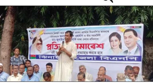
২-এর পাতায় দেখুন