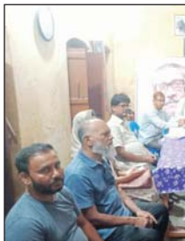
২-এর পাতায় দেখুন